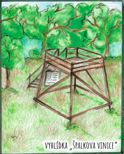
VYHLÍDKA „ŠPALKOVA VINICE“