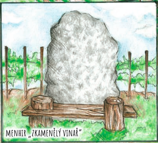
MENHIR „ZKAMENĚLÝ VINÁŘ“